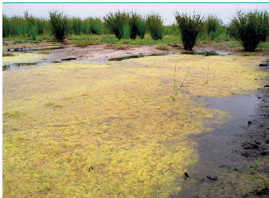
Snelle ontwikkeling van pitrus en algen na vernatting van landbouwgronden.